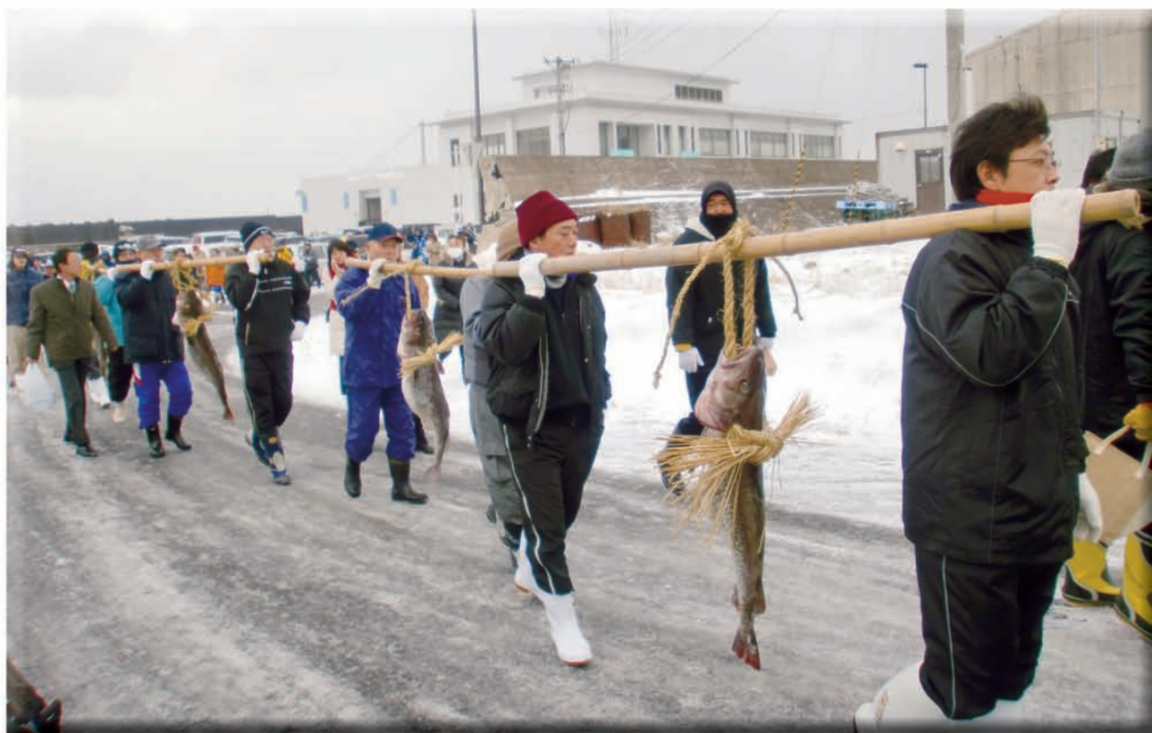
掛魚まつり(鰯まつり)