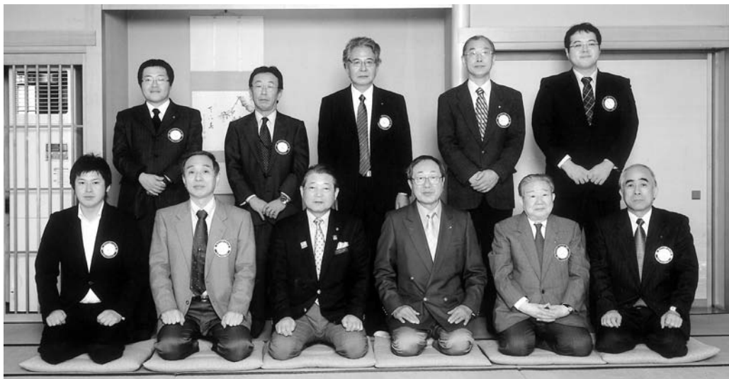
角館ロータリークラブ（2009年12月2日）